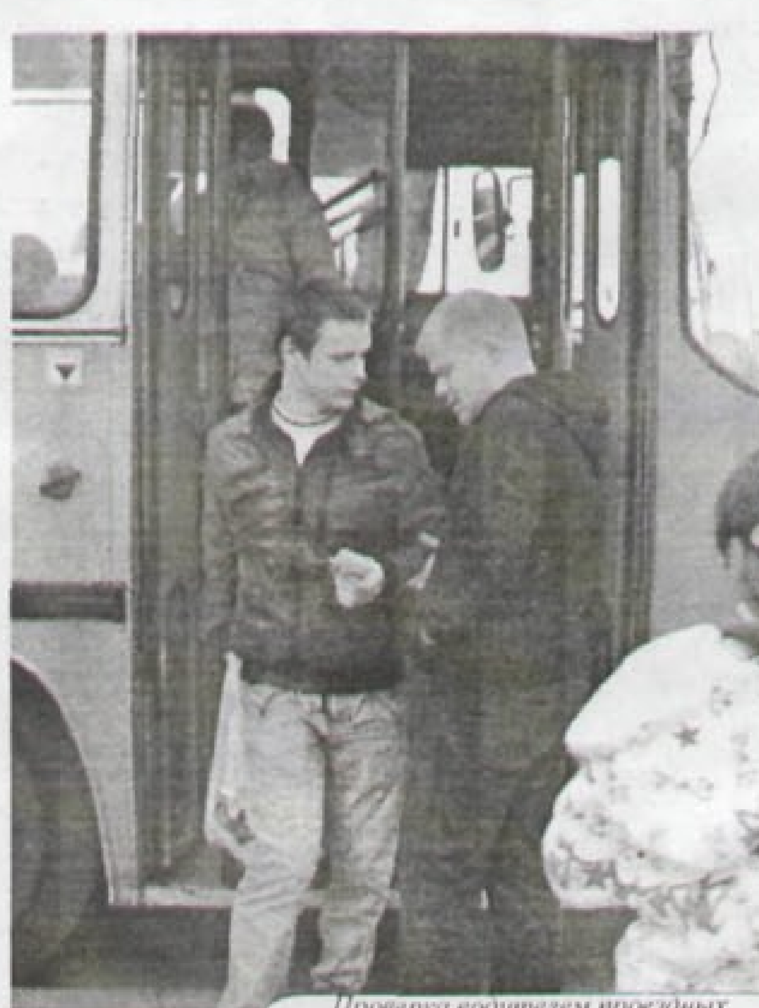
Проверка водителем проездных билетов на конечной остановке

Одной из составляющих успешного экономического развития предприятия является всеобщая оплата за проезд. На страже этого